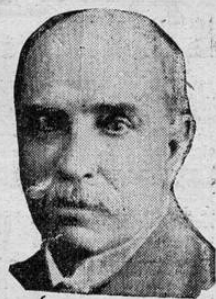
Ex presidente Jiménez

-- Se lanzó ayer en Tres Ríos la fórmula Jiménez Oreamuno-Vargas Coto --